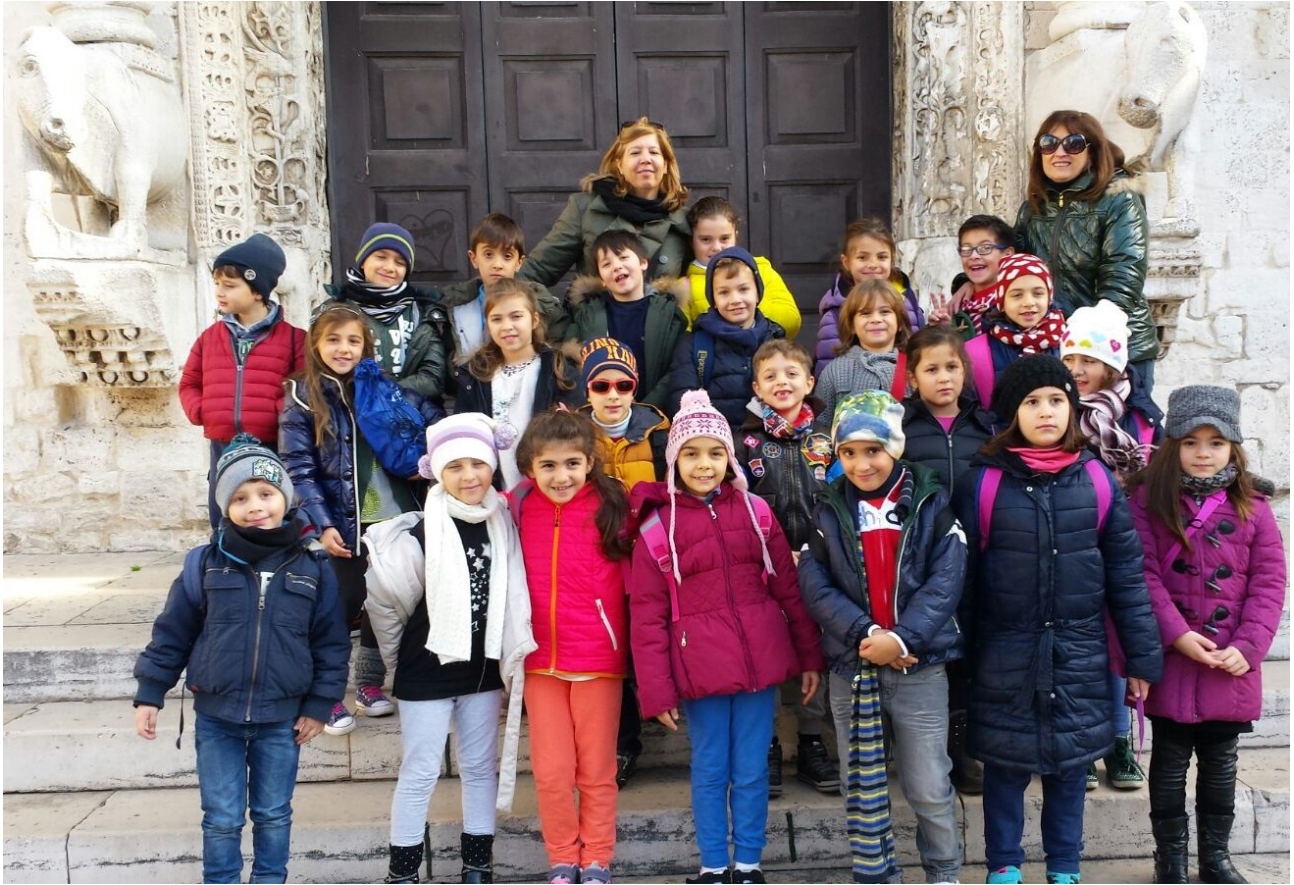
2^B all'ingresso della Basilica

All'interno, i bambini hanno avuto modo di osservare con interesse e stupore i più significativi elementi che caratterizzano lo stile romanico – pugliese