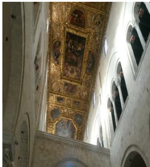
Soffitto dorato e matroneo