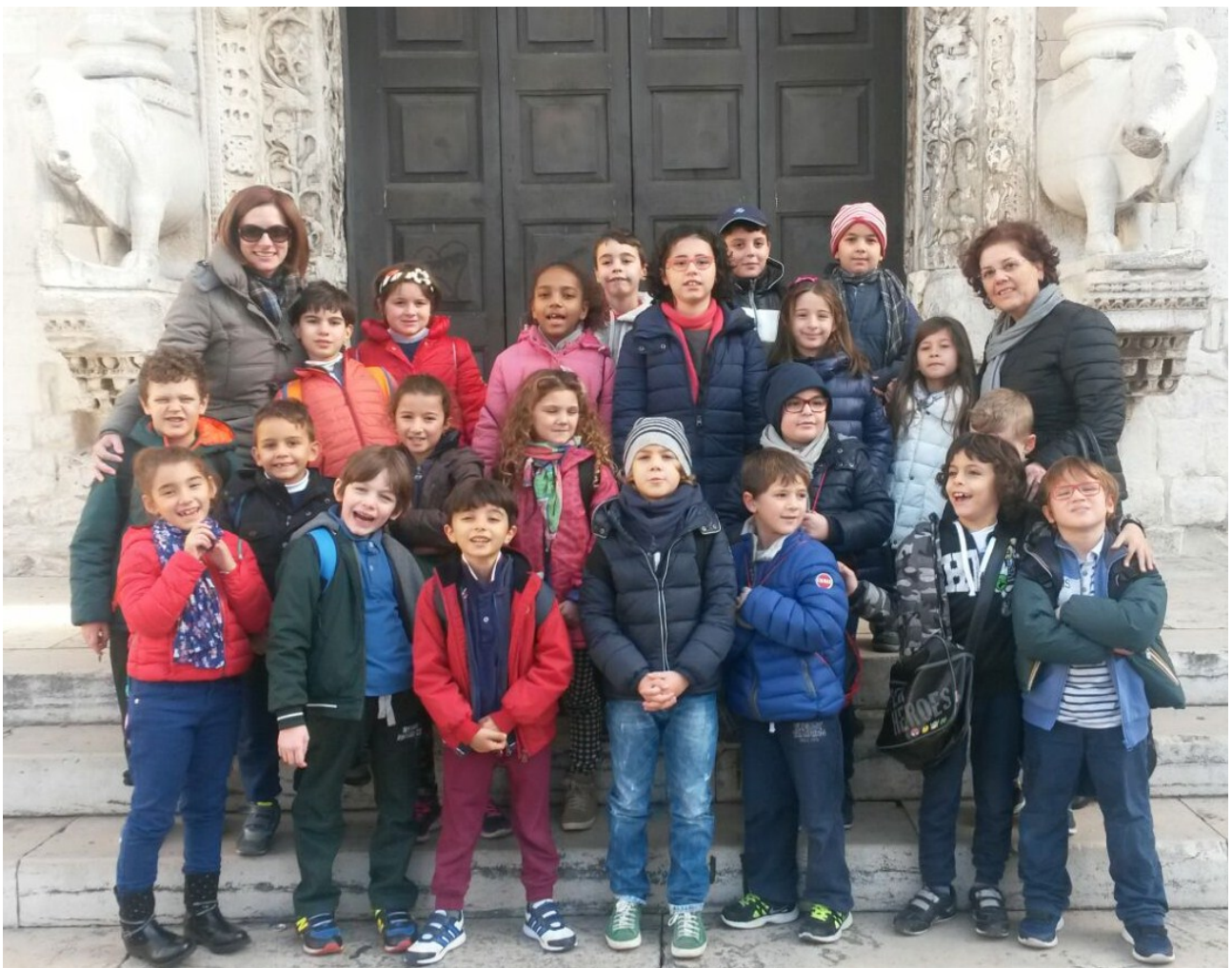
2 A all'ingresso della Basilica

A pochi giorni dalla festa di San Nicola, tanto attesa dai bambini, le classi 2 A e 2 B della Scuola Primaria “G. Cozzoli” si sono recate presso la Basilica di San Nicola a Bari.