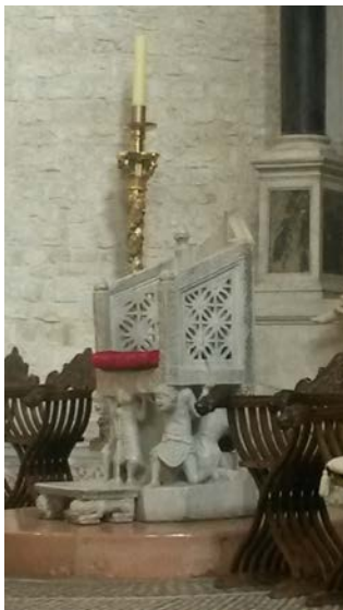
Cattedra di Elia

All'interno, i bambini hanno avuto modo di osservare con interesse e stupore i più significativi elementi che caratterizzano lo stile romanico – pugliese