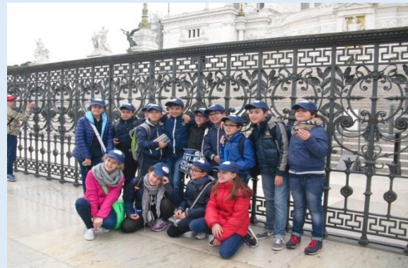
Altare della Patria