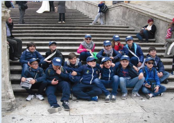
Trinità dei Monti