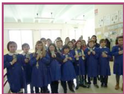
Giornata della Memoria: nelle foto i bimbi del campo di Terezin