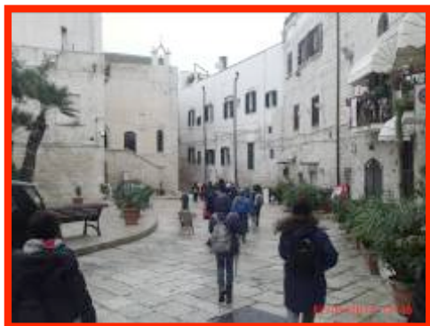
Visita al quartiere ebraico e alla Sinagoga "Scolanova" in Trani