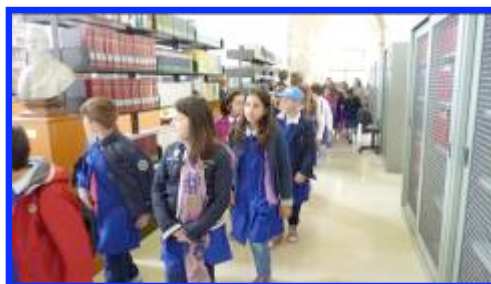
Visita alla biblioteca comunale