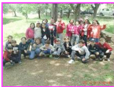
Un giorno alle grotte di Castellana