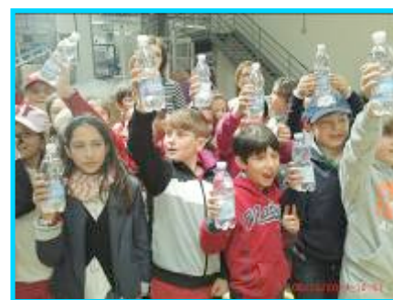
Nell'Azienda "Acqua Amata" di Casamassima