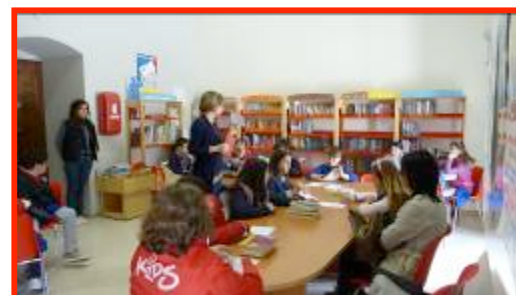
Lettura nella sala ragazzi