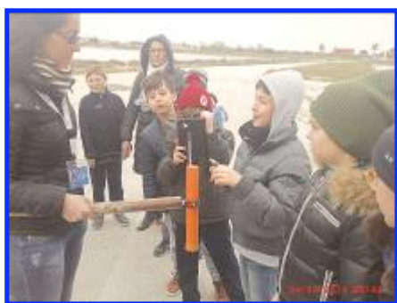
Esplorando le Saline di Margherita di Savoia