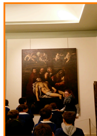
Molfetta: museo diocesano