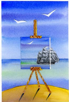
Viaggio nella Pittura, F. Nitti